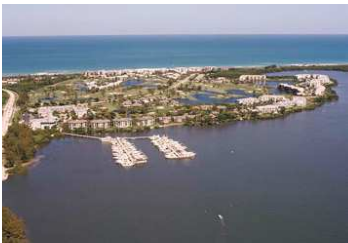
Marriott Beach Resort® & Marina

z podaniem Imienia i nazwiska rodzaju pokoju ( ilość łóżek ) , daty pobytu oraz Nr. karty kredytowej z datą ważności ( karta nie będzie obciążana lecz służyć będzie do zagwarantowania rezerwacji).